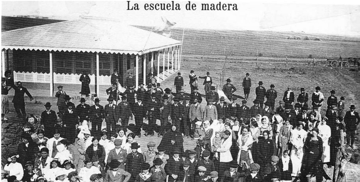
Festejos Patrios 1912 – Costa Grande, Diamante