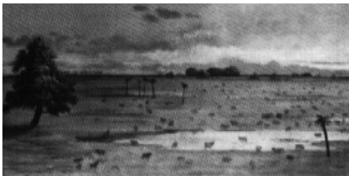
Invernada del ejército oriental, 5 de abril de 1866, 1887

Los artistas extranjeros y argentinos hicieron también pintura histórica o de batallas. Cándido López , pintó escenas de la guerra del Paraguay, tenía una visión muy particular, que lo distingue de los demás