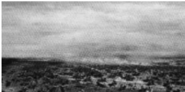
Batalla de Tuyutí, 24 de mayo de 1866